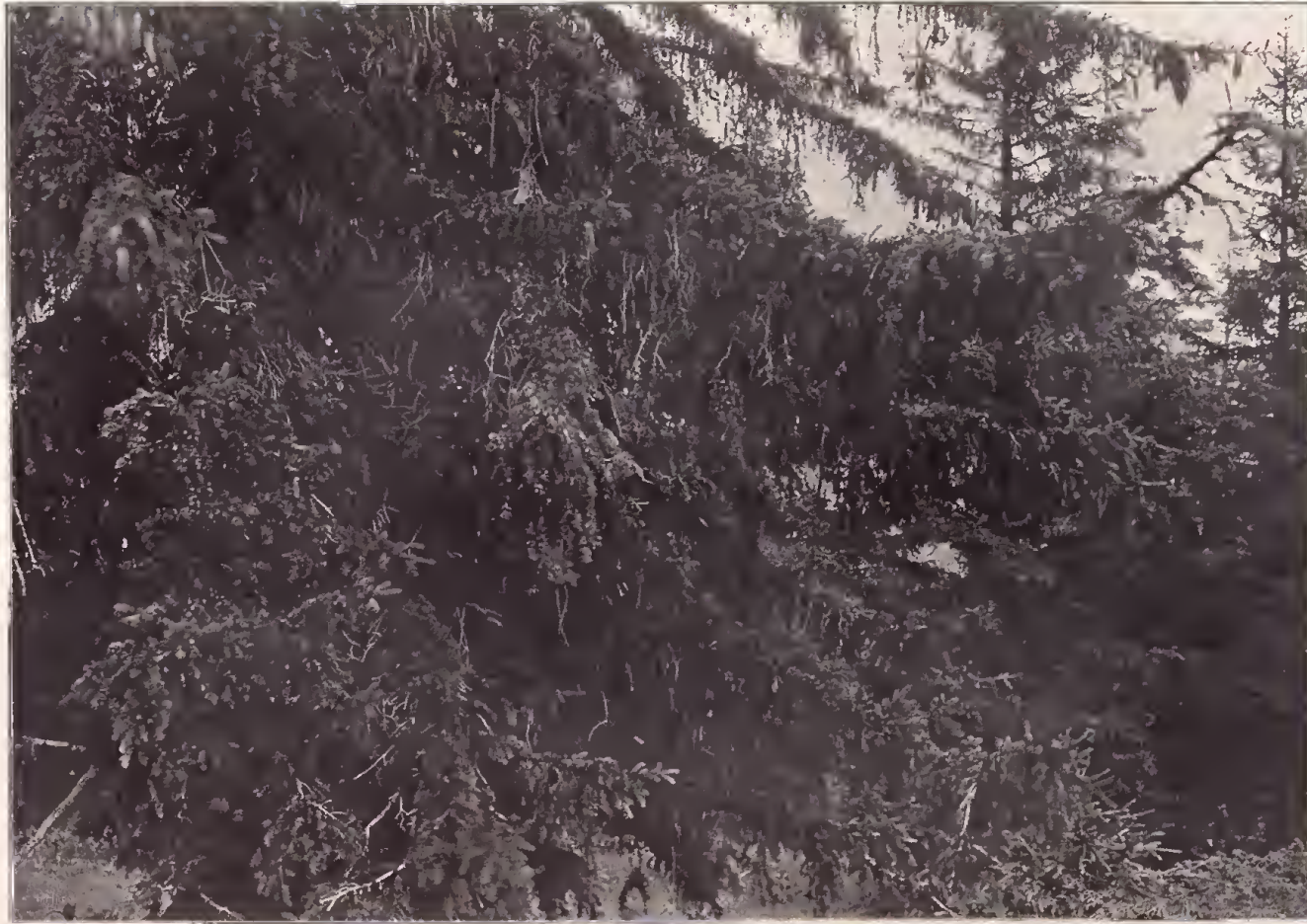
Reich mit Zweigen behangene Äste der Malixer-Fichte